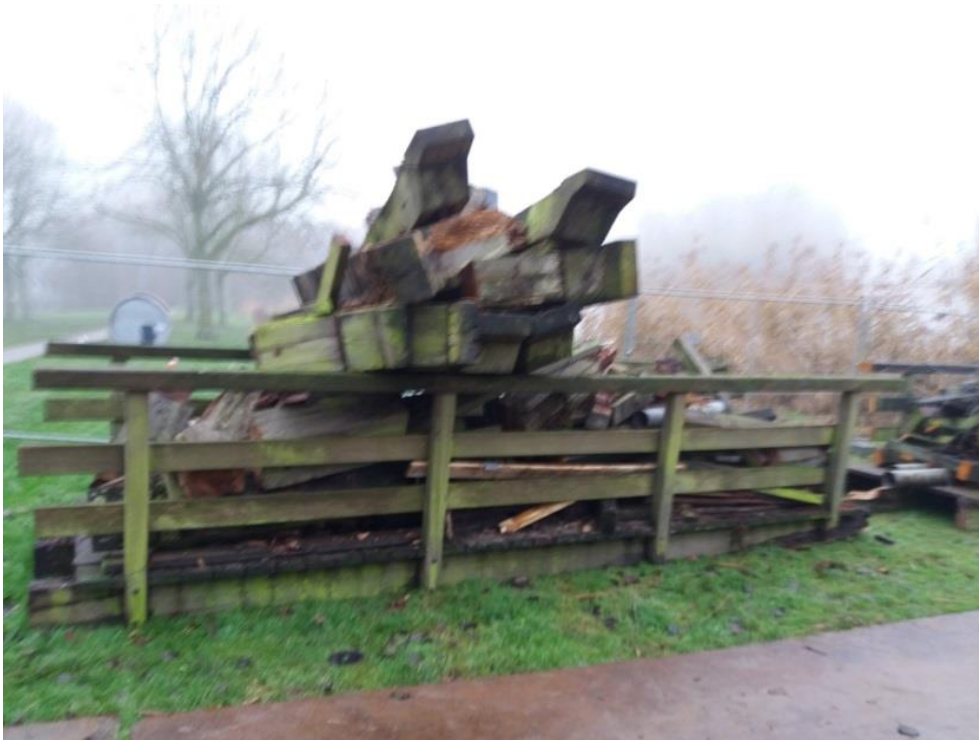
Vrijkomend materiaal brugdeel van de 3 e Waterbrug

Het is goed om te beseffen dat de genoemde hoeveelheden slechts gaan over het gemeentelijk bezit. Kunstwerken van Rijkswaterstaat of de Provincie zijn hier niet in opgenomen.